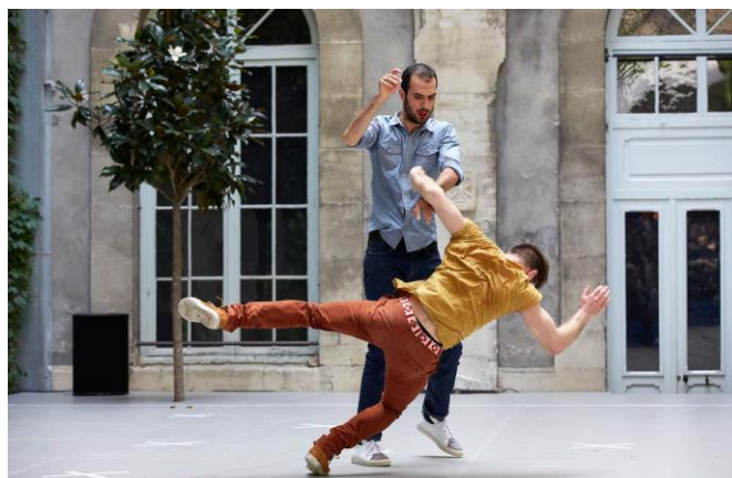
© Cie P. Rigal-Cie Dernière minute